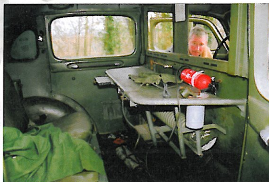
De verbindingapparatuur ontbreekt in Nasemans voertuig.

Met speciale dank aan Morten Synsteliën voor zijn foto's en informatie.