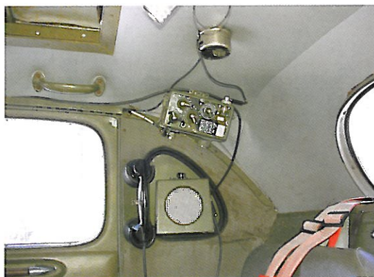
De aanpassingseenheid voor de RA200 antenne, RA200 aerial unit, de RA200 box en een handmicrofoon.

Mocht Naseman een dagtrip naar de Ardennen maken dan kunnen er twee rijwielers mee. Achterop de TP21 bevindt zich naast jerrycans en een stootbeugel een rek voor de stalen rossen. Volgens overlevering was dit één van de twee straffen voor de Zweedse militairen, vertelt Nase-