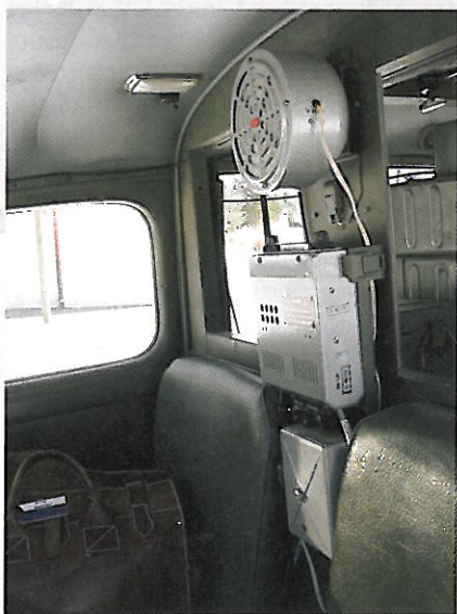
De MT 920 met box en transformator.